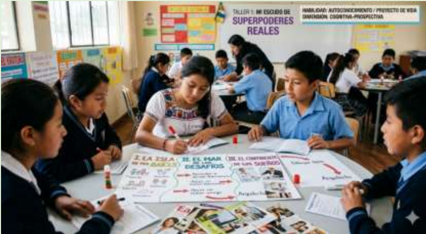
Gráfico 20 Mapa Visual de Metas