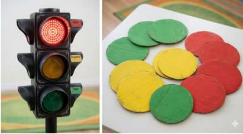
Gráfico 5 Semáforo de las emociones