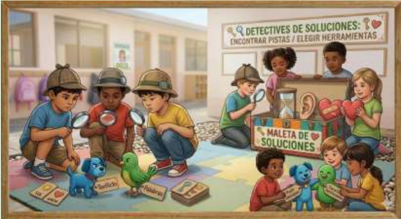
Gráfico 11 Laboratorio de Funciones Ejecutivas: Toma de Decisiones y Flexibilidad Cognitiva