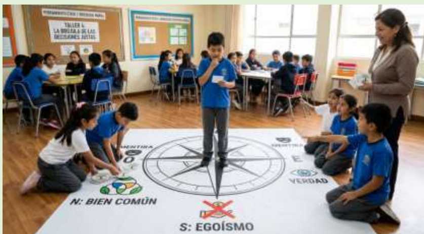
Gráfico 15 La Brújula de las Decisiones Justas