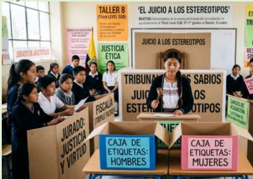
Gráfico 27 Tribunal de los Sabios