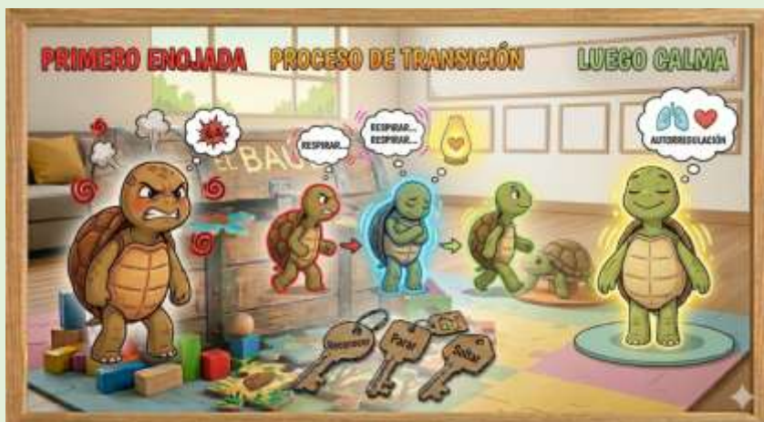
Gráfico 9 Autorregulación por Inhibición Muscular y Respiración Controlada