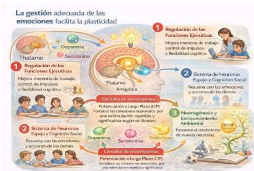
Gráfico 2 Gestión emocional para la plasticidad cerebral

La imagen ilustra cómo el circuito de recompensa mantiene abiertas las vías neuronales hacia un aprendizaje significativo. La