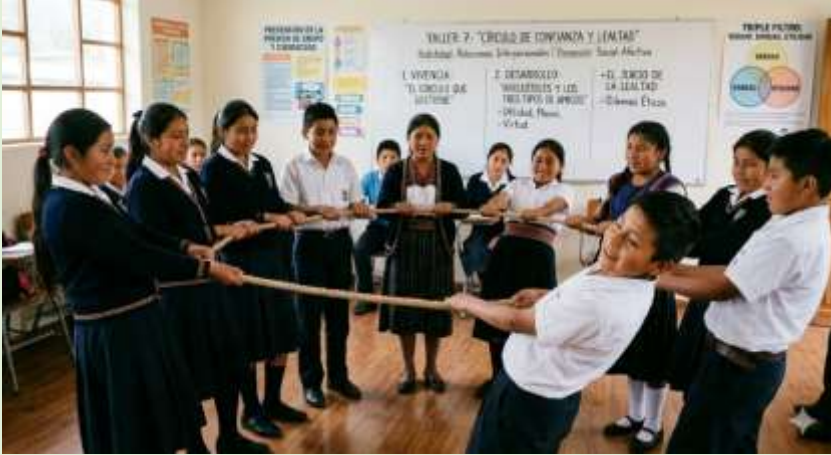
Gráfico 26 Dilemas Éticos sobre Lealtad y Confianza