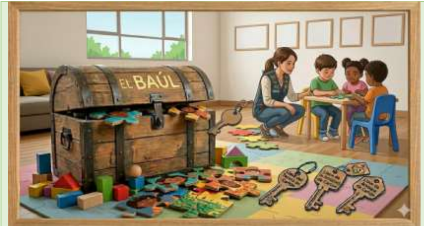
Gráfico 8 Baúl Simbólico de Seguridad