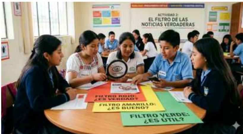
Gráfico 21 El Triple Filtro