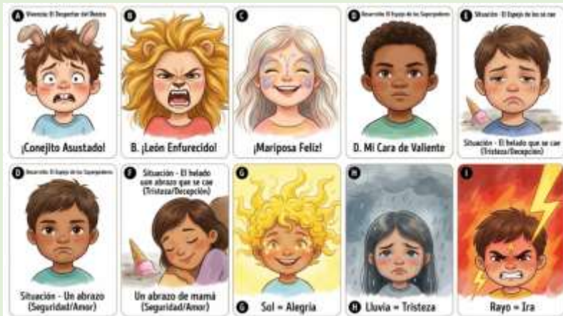
Gráfico 3 Estados Afectivos y Somatización Facial