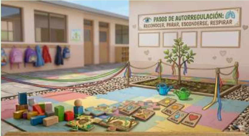
Gráfico 10 Desarrollo de la Responsabilidad Comunitaria