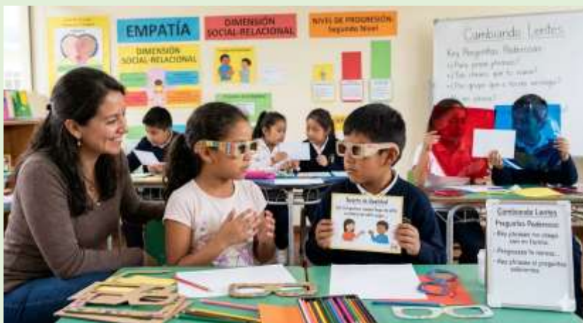
Gráfico 14 Estrategia Pedagógica para la Prevención de la Discriminación