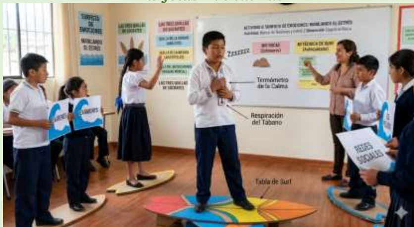
Gráfico 25 Manejo de Estrés y Autorregulación