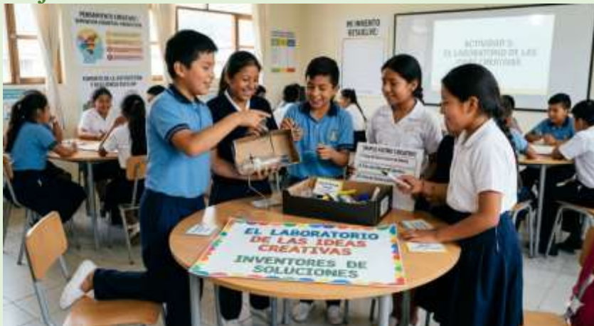
Gráfico 24 Pensamiento Creativo – Inventores de Soluciones