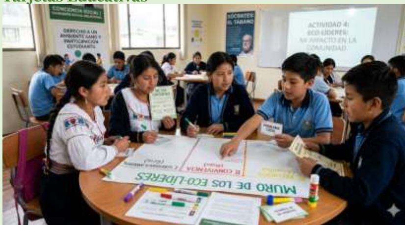
Gráfico 23 Diagnóstico Participativo y Micro-Metas Ciudadanas