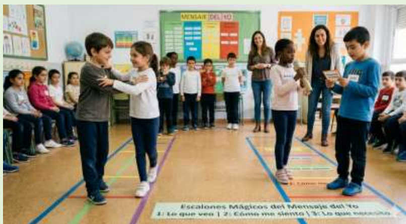
Gráfico 13 Puente de la Comunicación Asertiva