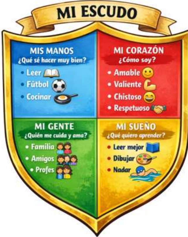
Gráfico 12 Escudo Personal de Aprendizaje