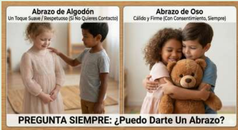
Gráfico 6 Autonomía Corporal y Consentimiento Progresivo