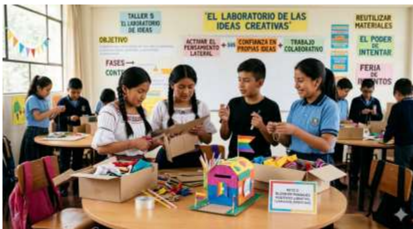
Gráfico 16 Resolución Creativa de Conflictos Escolares