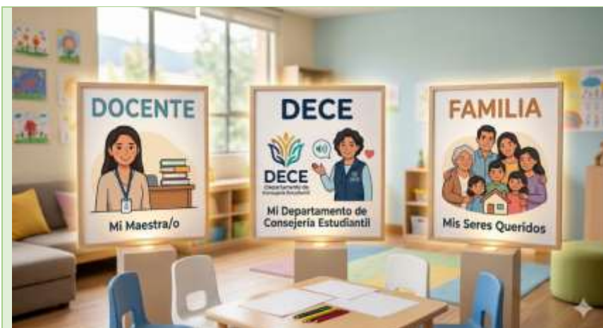
Gráfico 7 Autoridades y palabras mágicas