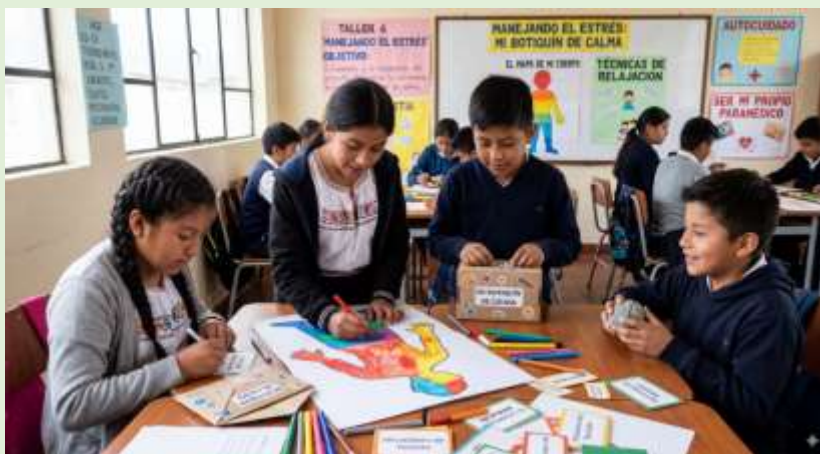
Gráfico 17 Autocuidado Emocional – Botiquín de Calma