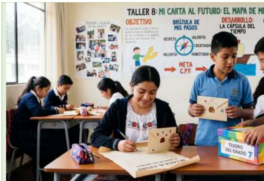
Gráfico 19 Carta al Futuro