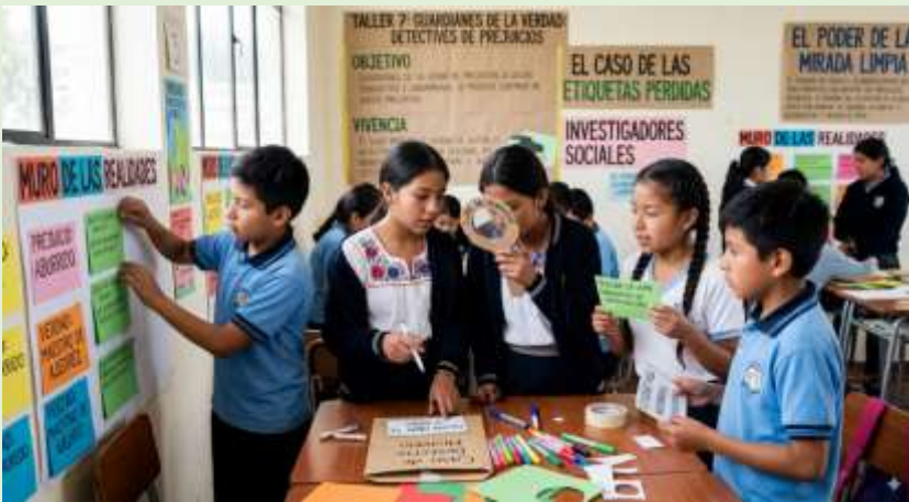
Gráfico 18 Identificación y Cuestionamiento de Prejuicios