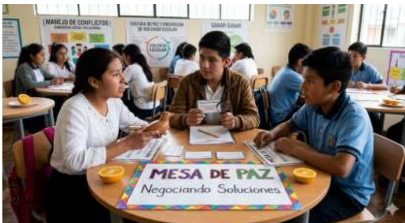
Gráfico 22 Mesa de Paz con Mediación de Pares